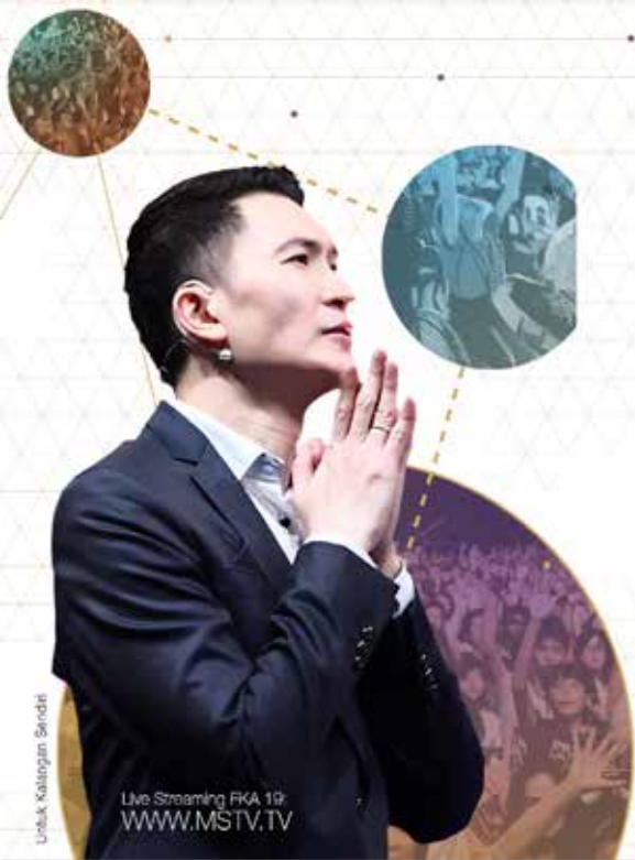
Untuk Kelengkapan Sendiri